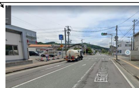
盛岡東警察署中野駐在所と セブンイレブン目印